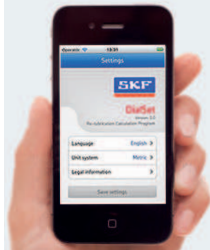
DialSet для смартфонов